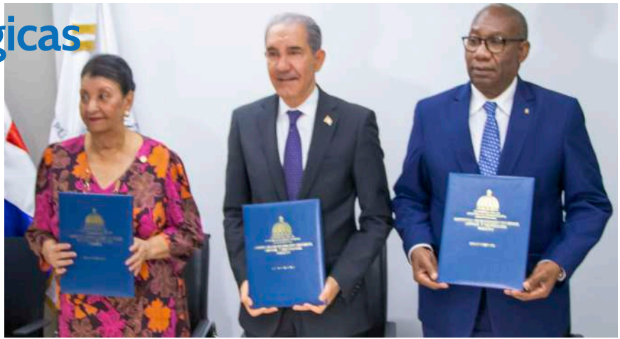
El acuerdo suscrito con el MESCYT y la UASD permitirá llevar la atención a infantes en centros regionales de la academia de estudios superiores.

Entre los convenios que impactan la formación de los colaboradores y colaboradoras como estrategia para garantizar la calidad de los servicios, se destacan los firmados con el Ministerio de Educación Superior Ciencia y Tecnología (MESCYT) y el Instituto Dominicano de Evaluación e Investigación de la Calidad Educativa (IDEICE), que buscan fomentar la cooperación académica y científica, a través de múltiples iniciativas.