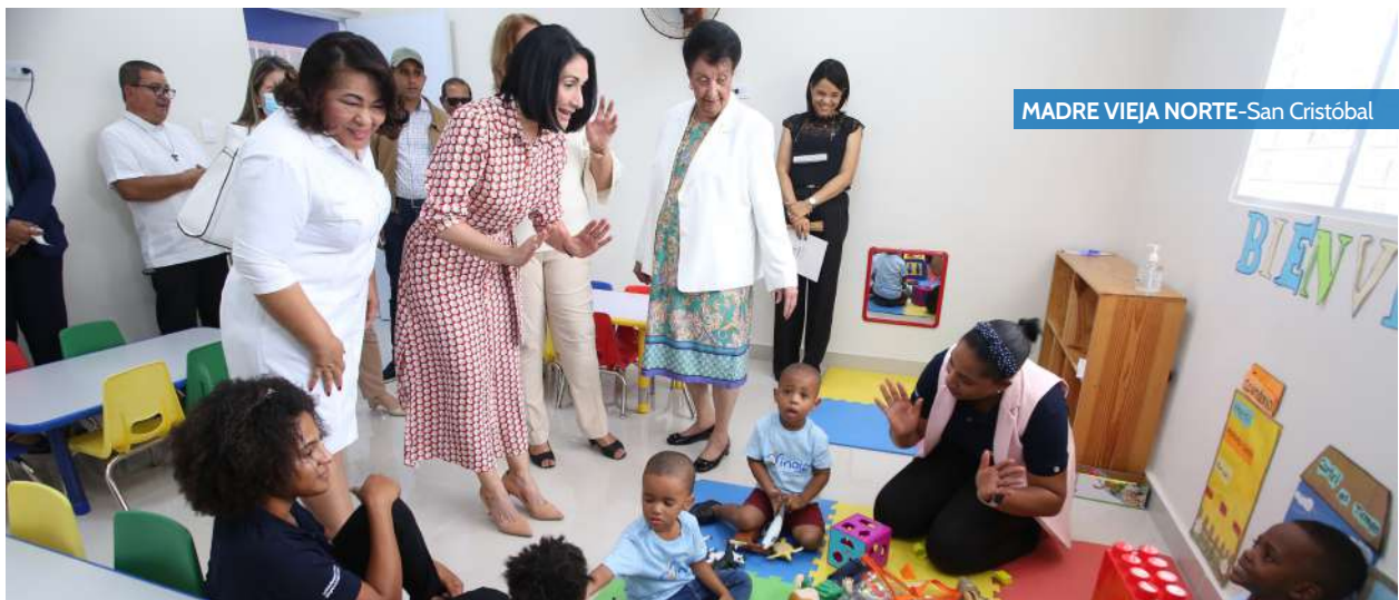
MADRE VIEJA NORTE-San Cristóbal

Mientras que otros 4,930 niños y niñas ya reciben atenciones integrales de calidad a través de los Centro de Atención a la Familia y la Infancia (CAFI), para completar así los 6,274 infantes de nuevo ingreso.