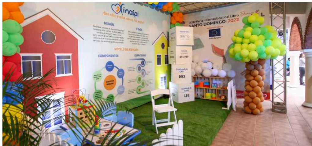
Stand del Inaipi en la Feria Internacional del Libro, dentro del pabellón del MinerD.

Con un colorido stand, alegórico a un Caipi, el Instituto Nacional de Atención Integral (Inaipi) tuvo una destacada participación en la XXIV versión de la Feria Nacional del Libro 2022 (FILSD2022). Cientos de estudiantes y personas