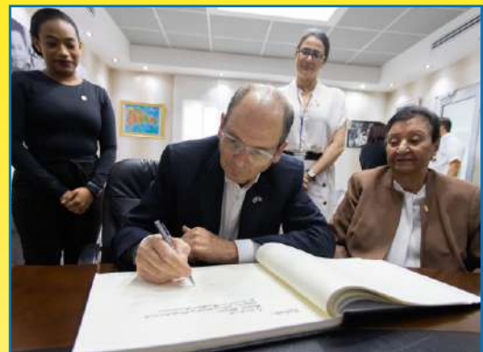
Daniel Birán, embajador de Israel en el país, firmó el libro de Visitantes Distinguidos del Inaiipi.