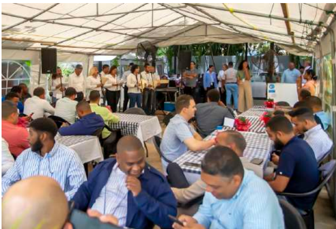
Entre cantos y poesías, los padres disfrutaron el agasajo preparado por la Dirección Ejecutiva.