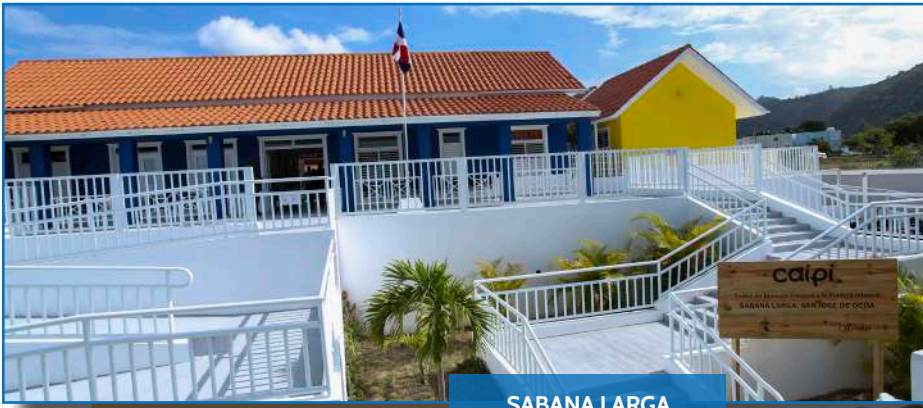
SABANA LARGA -San José de Ocoa-