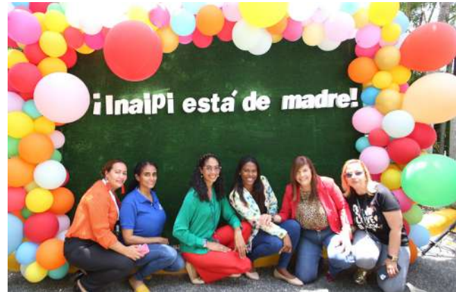
Las damas aprovecharon para disfrutar el espacio preparado para celebrar el Día de las Madres.