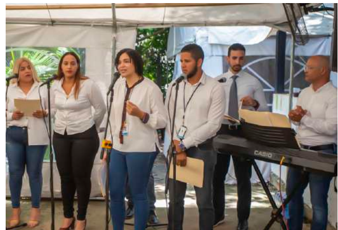
El coro institucional tuvo a su cargo amenizar las actividades.