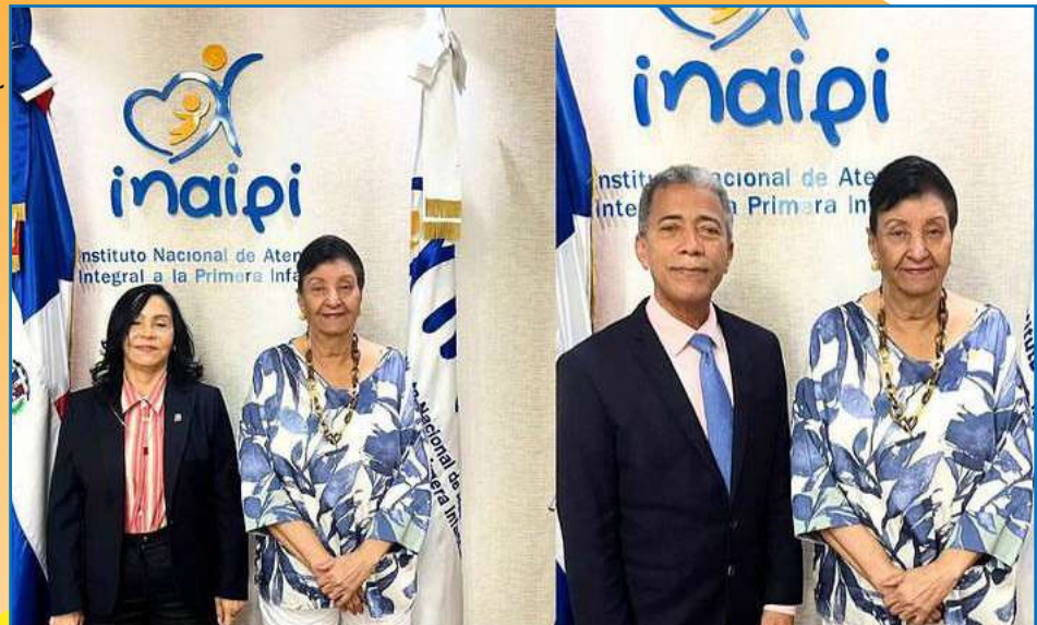
Nuestra directora ejecutiva recibió en su despacho a la embajadora de República Dominicana en Guatemala, Sara Paulino y a su esposo Domingo Peña.

Diversas personalidades interesadas en conocer sobre las políticas públicas en favor de la primera infancia.