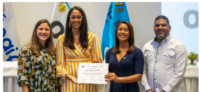
Directivos de la OEI, INAFOCAM y el Inaipi, entregan el certificado a una de la colaboradoras capacitadas en el diplomado.