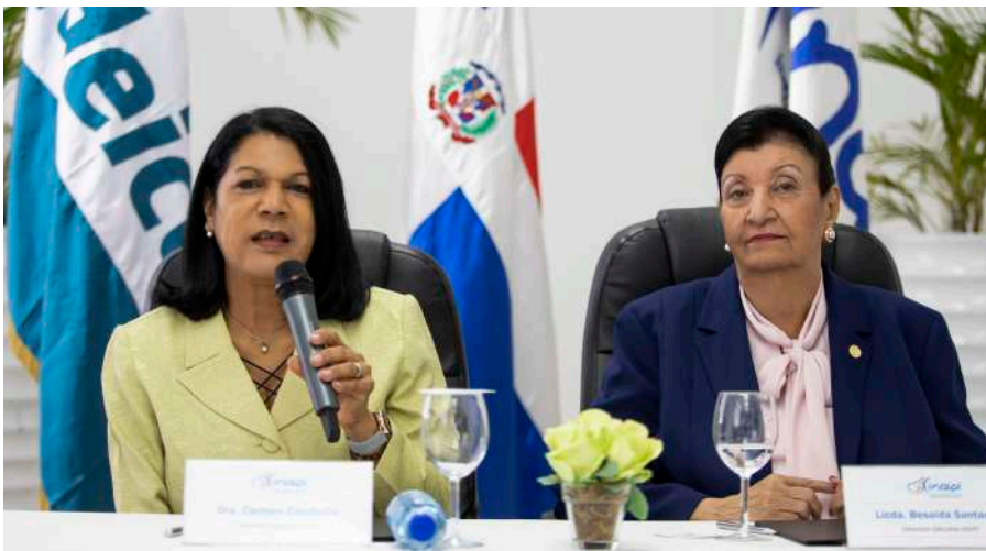
Inaipi y el IDEICE trabajarán en cooperación académica y científica para fortalecer las atenciones a los infantes.

Otro acuerdo importante es el firmado junto al Programa de Medicamentos Esenciales y Central de Apoyo Logístico (PROMESE/ CAL), entidad que suplirá al Inaipi los medicamentos e insumos sanitarios necesarios para garantizar las atenciones de salud que requieran las niñas y los niños.