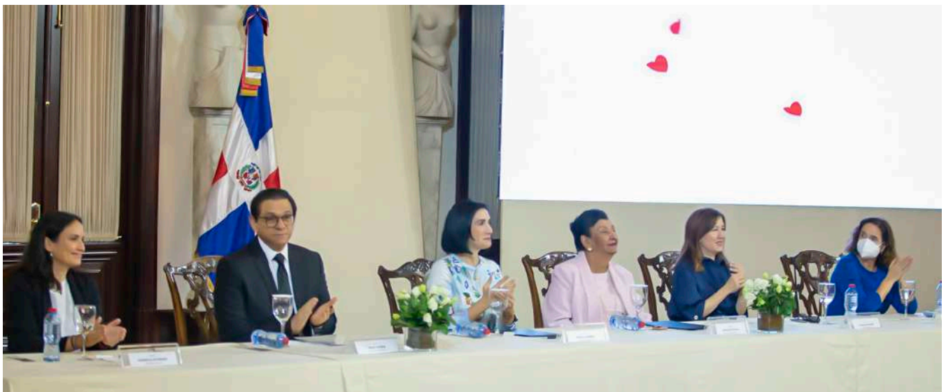
El lanzamiento de la campaña “La Lactancia es un acto de amor” fue celebrado en el Palacio Nacional, en el inicio de la celebración de la Semana de la Lactancia Materna el 7 de agosto.

La campaña “La lactancia es un acto de amor”, promueve, además, la creación de una red nacional de donación de leche materna para fortalecer los bancos de leche humana existentes, ya que el país cuenta con 133 salas de lactancia, de las cuales 82 se pertenecen al Inaipi, desde donde se promueve la lactancia materna, se sensibiliza y dan seguimiento a las embarazadas y madres lactantes.