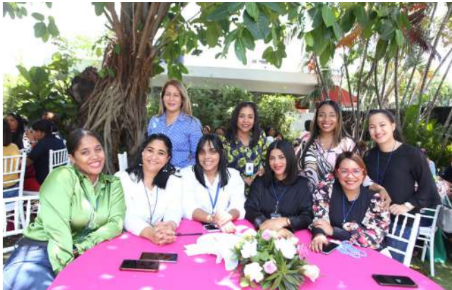
Compartiendo entre ellas, las madres disfrutaron del almuerzo preparado en los Jardines de la institución.