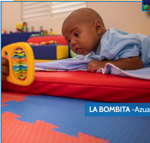
LA BOMBITA -Azua-