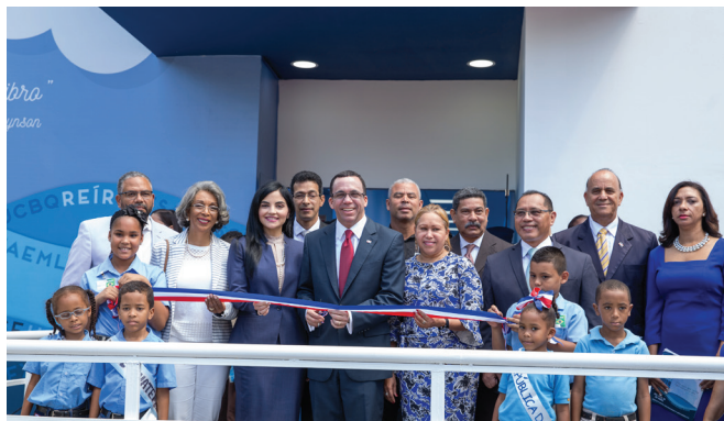
Momentos de la inauguración del stand del MINERD en la XXI Feria Internacional del Libro Santo Domingo 2018.