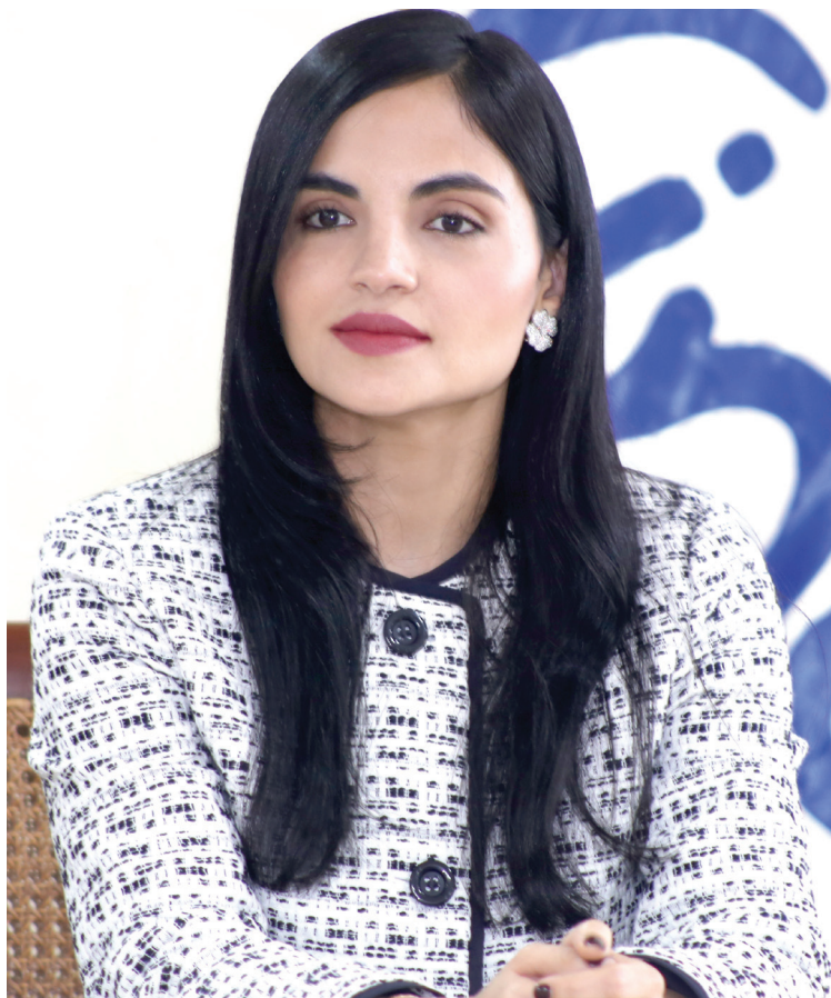
Berlinesa Franco Directora General del INAIPI

También damos seguimiento, desde la sede central, a la operatividad de los Centros CAIPI y CAFI que tenemos funcionando a nivel nacional mediante una plataforma digital que permite el proceso de selección de forma automática, registro y pase de lista, las solicitudes y control de suministro, gestión y seguimiento a los componentes de salud y nutrición, registro de nacimiento, vacunación e incidencias de salud. También se digitalizan documentos, el registro y las estadísticas de los niños, niñas y las